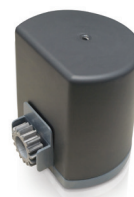
napęd do bram przesuwnych SIMPLE MOVE 102