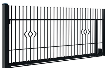
brama przesuwna z szyną prowadzącą