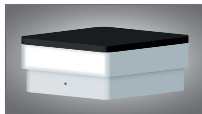
białe światło strefowe (oświetlenie podjazdu)

Brama przesuwna bez przeciwwagi dostępna jest również bez automatu